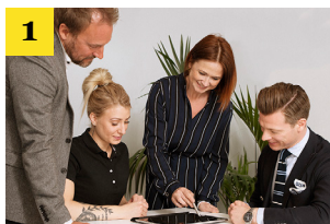
1 Kartlegge behovene

Sammen gjennomfører prosjektgruppen en innsamling av informasjonskilder og tester for å sikre at resultatet skal oppfylle forventningene.