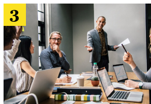
3 Gjennomføre endringer